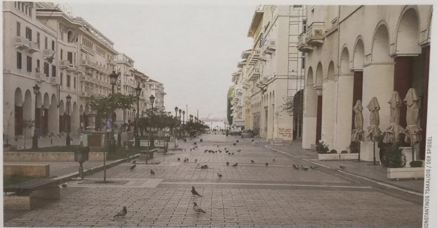
Thessaloniki, Griechenland 2,2 Millionen Touristen pro Jahr

TUI, den zur Rewe-Gruppe gehörigen Wettbewerber ITS, DER Touristik oder das Münchner Unternehmen FTI.