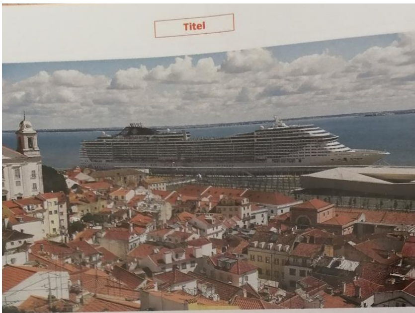
Lissabon, Portugal 7,5 Millionen Touristen pro Jahr