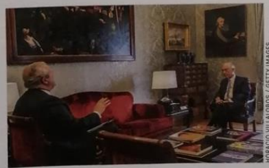
Touristiker Calheiros, Präsident de Sousa Fantasie braucht der Mensch

Fährt man Ende April nach Sylt, braucht man viel Fantasie, um hier eine Ferieninsel zu sehen. An der Auffahrt zum Verladebahnhof für den Autozug steht die Polizei und befragt alle Passagiere; nur Erstwohnungsbewohner und Arbeitspendler dürfen auf die Insel. Alle anderen hätten auch wenig Freude: Die Hotels und Restaurants sind für Touristen geschlossen.