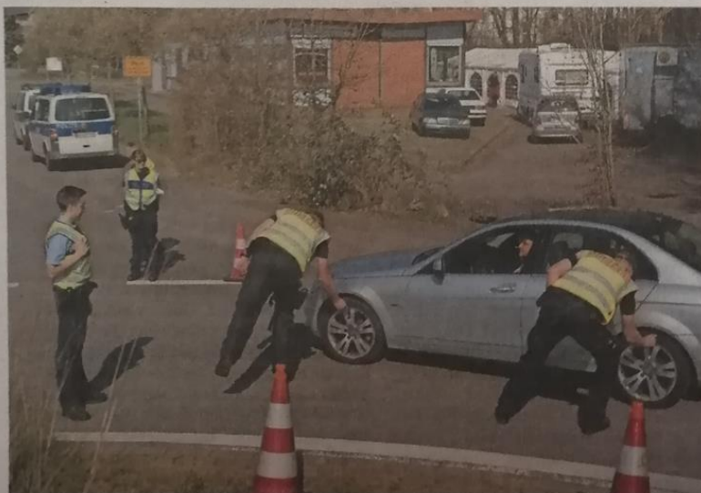
Die Polizei kontrolliert an der deutsch-französischen Grenze.

Am 11. Mai will Frankreich seine Ausgangssperre aufheben, doch der sanitäre Notstand soll noch bis zum 24. Juli anhalten. Die Grenzkontrollen werden noch einige Wochen dauern, sagt ein Sprecher des französischen Innenministeriums in Paris. Doch man habe sich in deutsch-französischen Regierungskonsultationen vor zehn Tagen versprochen, Lösungen zu finden, die pragmatischer an die jeweiligen Lagen der Grenzgänger angepasst sein sollen.