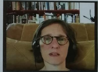
A. L. Kennedy, 54, lebt in Wivenhoe. Ihr Roman »Süßer Ernst« erschien 2018.

Lévy: Ich möchte zweierlei sagen. Zum einen bin ich voller Bewunderung für Angela Merkel. Alle haben sie unterschätzt: Helmut Kohl, Gerhard Schröder, die Männer in ihrer Partei und die Medien. Wieder und wieder. Und jetzt? Alle dachten, sie sei am Ende. Tatsächlich hat sie in der Krise vorbildlich agiert. Zum anderen: Deutschland möchte nicht führen. Das finde ich gut. Denn in Europa gibt es diese Führung nicht. Viele Leute glauben, dass das mit der Geschichte zu tun hat. Aber das stimmt nicht. In Wirklichkeit ist