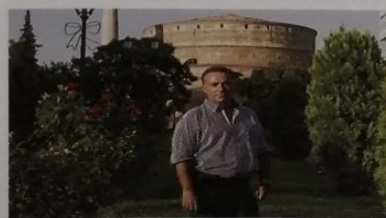
Reiseführer Sfikas Auch die Amerikaner bleiben fort

Auch Partnerfirmen wie Transportunternehmen oder Ausflugsveranstalter werden mit in den Abwärtstrudel gerissen. Wie schlimm es die Fluggesellschaften erwischt hat, zeigt ein Vergleich mit der Finanzkrise. Damals brauchte es ein ganzes Jahr, bis die Passagierzahlen an europäischen Flughäfen um 100 Millionen Gäste