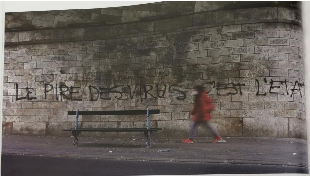
Schriftzug in Paris*: Wie wird der Kontinent nach Corona aussehen?

„Spiegel-Gespräch: Ein Gipfeltreffen europäischer Intellektueller“, 2.5.2020 Diskussion zwischen Intellektuellen aus verschiedenen Ländern (unter anderem Frankreich) über das Leben in der Krise und die Zukunft Europas