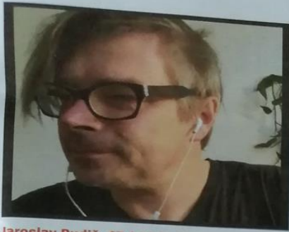
Jaroslav Rudiš, 47, lebt in Berlin und Prag. Zuletzt veröffentlichte er seinen Roman »Winterbergs letzte Reise«.